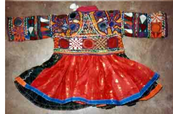
Haut de cérémonie pour petit garçon agrémenté de motifs en appliqué et brodés à l'aiguille