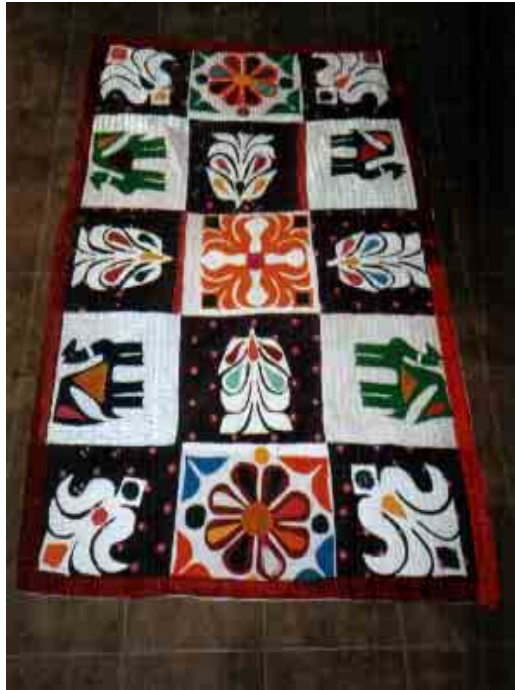
Couverture surpiquée et agrémentée de motifs en appliqué réalisés avec des vêtements découpés