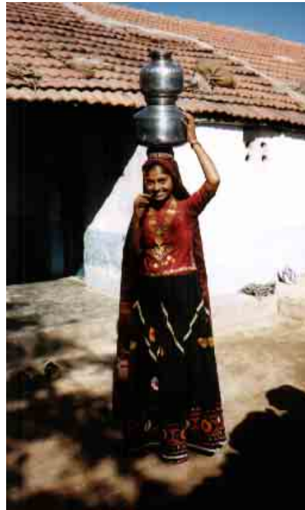
Jeune fille gujarati habillée en Bhopâ