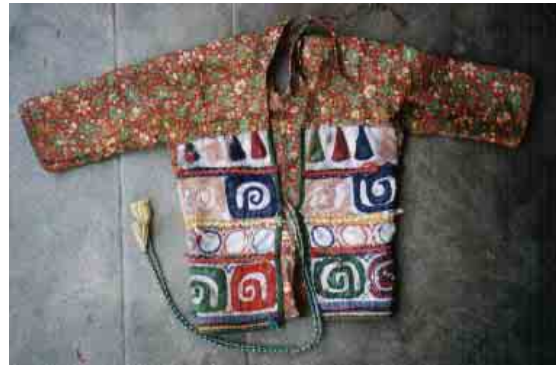
Dos d'un haut de fillette agrémenté de motifs en appliqué