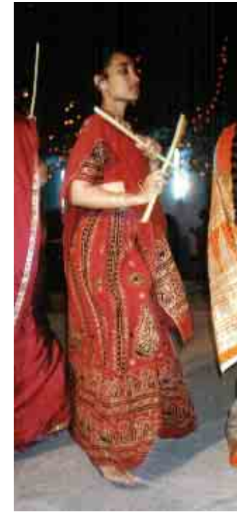
Jeune fille habillée en Rebârî lors de la fête de Navrâtri (Bhuj, 1996)