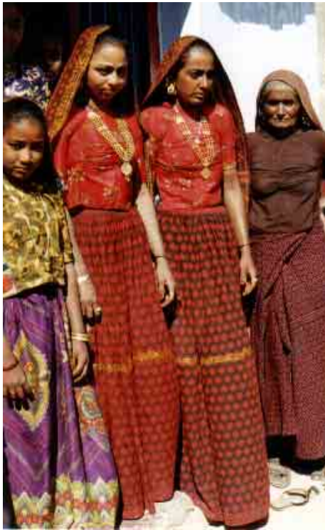
Trois générations de femmes bhopâ habillées selon l'usage