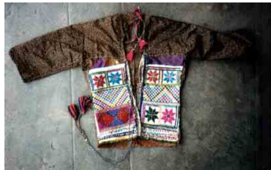
Dos d'un haut de fillette agrémenté de motifs en canevas