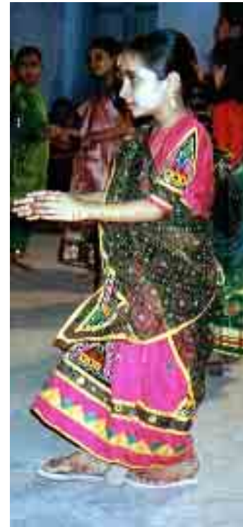
Petite fille habillée en Rebârî lors de la fête de Navrâtri (Bhuj, 1996)