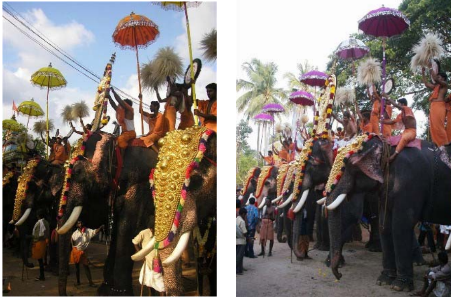
Figure 11 Les deux camps Ganapati (à gauche) et Devi (à droite) pendant le pooram au temple.