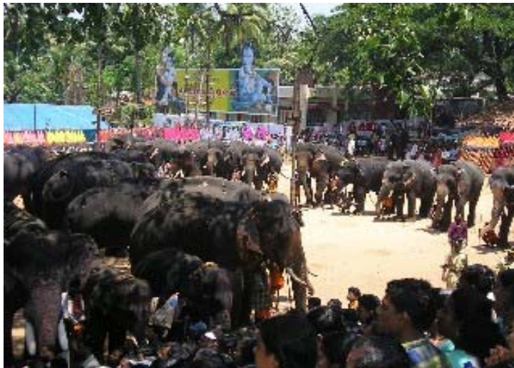
Figure 9 (gauche) Les 55 éléphants sont prêts à recevoir le Aana youto (photo N. Lainé, avril 2005).

Chacun des plateaux est déposé sur une marche qui mène au srikovil devant l'allée centrale du temple (voir photo ci-dessous). Les femmes prennent place sur les marches à côté des paniers de fruits. Il est 12h40 et les éléphants sont maintenant invités à se positionner autour du banyan .