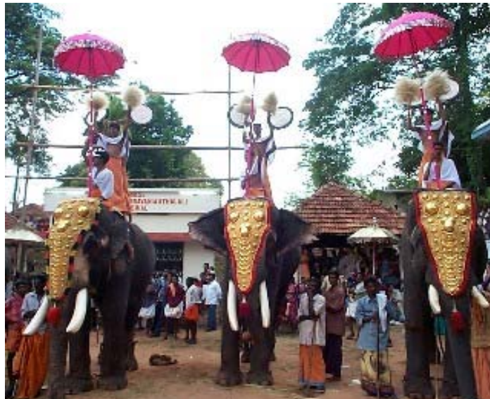
Figure 4 Pendant le Pooram 2004 à Quilon, trois éléphants vêtus de leurs ornements ; muthukuda , alavatham , vengamaran et thidambu . (photo N. Lainé, avril 2004).

Le moment fort de chaque pooram réside dans le kudumatton qui est l'échange des différents parapluies de variétés et de couleurs différentes. Chacun des deux camps n'étant pas supposé connaître la forme des parapluies du camp opposé. Il est à noter que depuis quelques années, cette cérémonie a tendance à se produire dans de nombreux autres endroits au Kerala dans le but de copier le prestigieux Trichur Pooram .