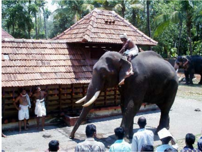
Figure 5 Le mahout prépare son éléphant avant la course (photo N. Lainé, avril 2005)

La foule commence à s'échauffer et chacun prend place en attendant le début de la course maintenant. Les femmes se sont toutes réfugiées devant le bâtiment administratif, elles poussent des cris stridents, les kukris en préparation de l'événement. Le mahout monte sur l'éléphant et se rapproche de l'effigie de Murugan.