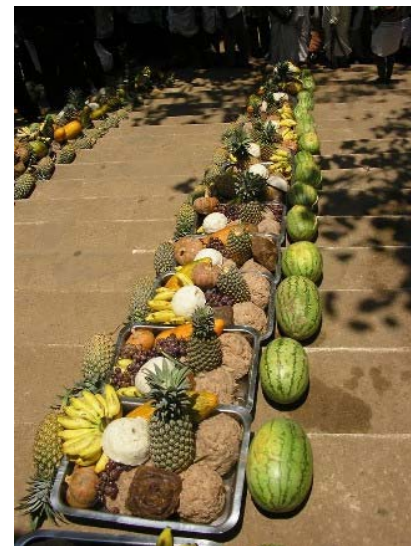
Figure 10 (droite) Les paniers pour le Aana youto (photo N. Lainé, avril 2005).

Il est 13h maintenant les éléphants sont tous positionnés en cercle autour de l'arbre sacré. Le responsable du festival annonce au micro la distribution d'offrande pour chaque animal. Les dévots qui ont sponsorisé un éléphant sont appelés à venir leur offrir le panier de fruits. Les femmes sont assises sur les marches tandis que les hommes observent depuis l'enceinte du temple. La cérémonie dure une demie heure, le temple est déserté pour un temps, entre 14