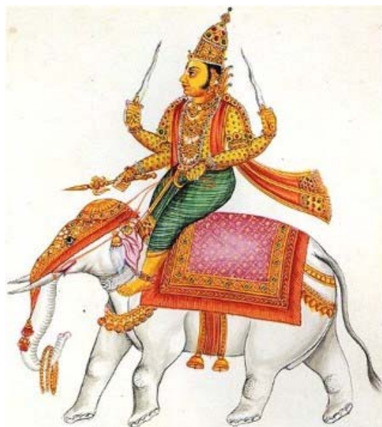
Figure 2 Indra, le dieu de la guerre sur sa monture Airavata