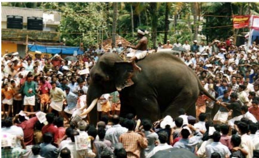
Figure 6 Pendant la course lors de notre premier séjour (photo N. Lainé, mars 2004)

Au total, la course n'aura duré que quelques secondes (10 environ), après quelques moments de panique et d'affolement, chacun reprend son calme et sa place autour du temple. Il n'est pas tout à fait 11h45 et la course est finie, les dévots forment plusieurs lignes et vont recevoir de la nourriture offerte par le temple, le sathya .